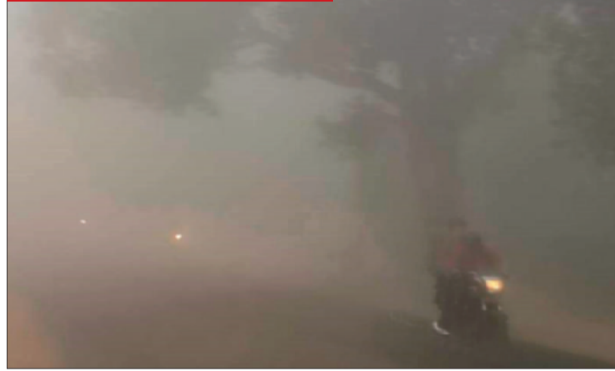
बैकुंठपुर। मंगलवार को शहर घंटों घने कोहरे से ढंका रहा। इस दौरान दूरतथा काफी कम रही, इसके चलते सड़क पर वाहनों की रफ्तार भी कम हो गई थी। इस दिन सुबह 10 बजे के पश्चात भी कोहरे ढंके रहे।